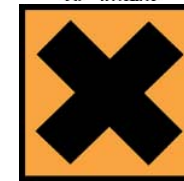
Xn - Nocif