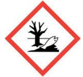
N - Dangereux pour l'environnement